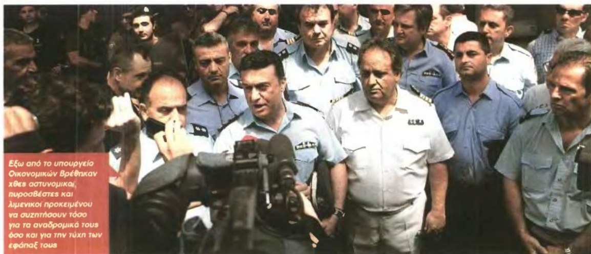
Εξω από το υπουργείο Οικονομικών βρέθηκαν χτες αστυνομικοί, πυροσβέστες και λιμενικοί προκειμένου να συζητήσουν τόσο για τα αναδρομικά τους όσο και για την τύχη των εφάπαξ τους

Παράλληλα, από τον Ιανουάριο του 2015 καταργούνται όλοι οι φόροι υπέρ τρίτων, εξέλιξη που επίσης επηρεάζει τουλάχιστον 10 επικουρικά ταμεία (όπως Νομικών, Αρτοποιών,