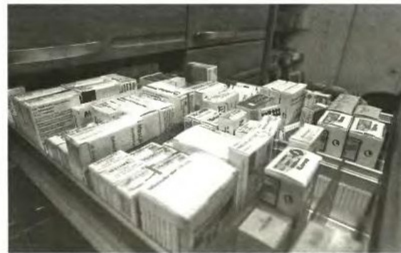
Η μεσοσταθμική συμμετοχή των αρρώστων στην αγορά των φαρμάκων, από 9% το 2009, θα εκτιναχτεί - σύμφωνα με τεχνοκράτες - σε 32% το 2014

Σύμφωνα με τους γιατρούς, το πλαφόν που προβλεπόταν για πολλές κατηγορίες ασθενών, υπολειπόταν κατά πολύ από τις πραγματικές τους ανάγκες. Για παράδειγμα, στους καρδιολόγους είχε οριστεί πλαφόν 35-40 ευρώ το μήνα ανά ασθενή, για τους πνευμονολόγους γύρω στα 60 ευρώ, για τους ενδοκρινολόγους 60 ευρώ. Για τους παθολόγους ο μέσος όρος είναι 55 ευρώ. Επίσης, δεν είχε προβλεφθεί διαφοροποίηση σε εξειδικευμένες παθήσεις, ό-