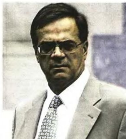
>> Ο υπουργός Οικονομικών Γκ. Χαροúβελης

πόθεν έσοχες, αλλά θα επεκτείνεται και στη διακρίβωση αν η απόκτηση νέων περιουσιακών στοιχείων ή η επαύξηση υφιστάμενων δικαιολογείται από το ύψος των πάσης φύσεων εσόδων, συνδυασμό με τις δαπάνες διαβίωσης των υπόχρεων σε δήλωση προσώπων.