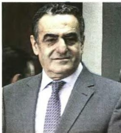
>> Ο υπουργός Δικαιοσύνης Χ. Αθανασίου

Ο έλεγχος δεν θα αφορά μόνο στα εισοδήματα και τα περιουσιακά στοιχεία που δηλώνονται στις δηλώσεις