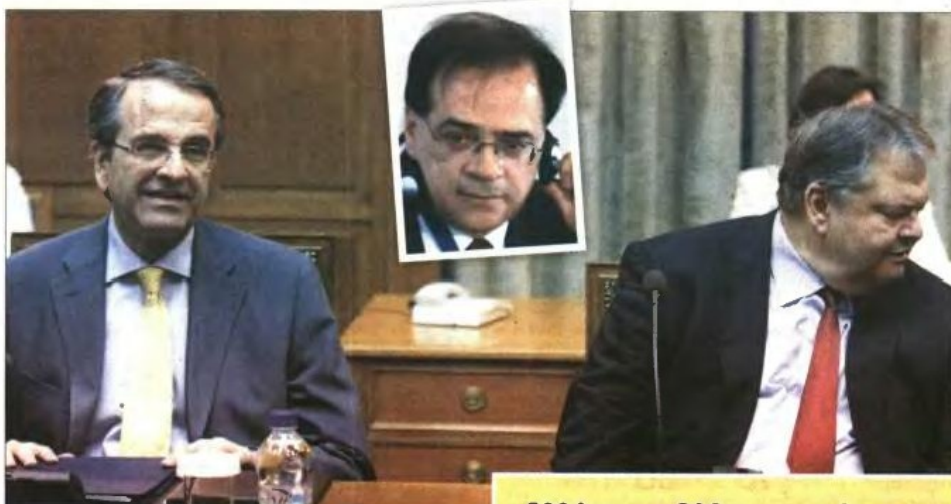
Ο πρωθυπουργός Αντ. Σαμαράς με τον Ευ. Βενιζέλο σε παλαιότερη συνάντησή τους. Ενθετή: Ο υπ. Οικονομικών Γιώργος Χαρδούβελης